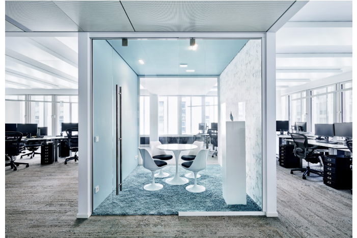
6 Meetingbox 'Hansi goes down'