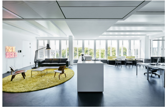
2 Empfang mit angrenzenden Arbeitsplatzbereichen