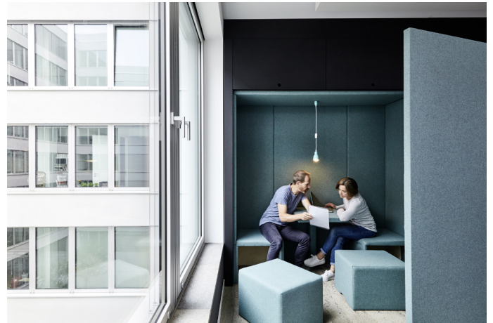
4 Hinter Klappwand integrierte Sitznische im Open Space