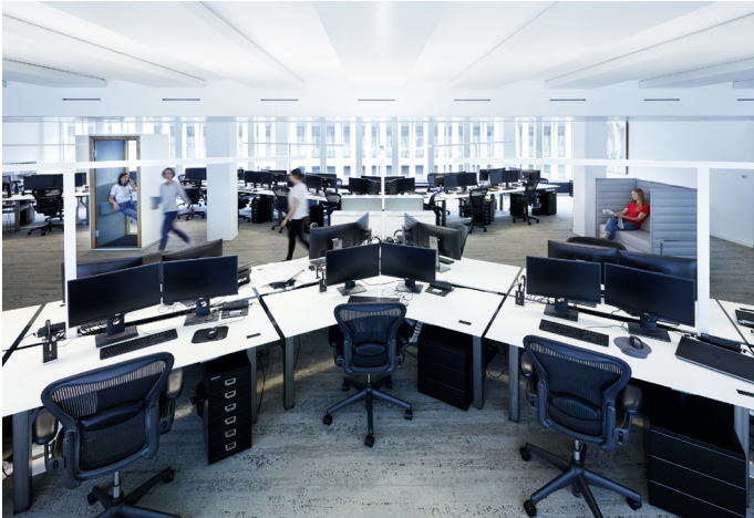
5 Open Space