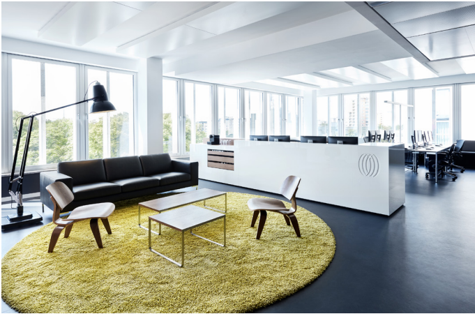
1 Empfang mit Wartelounge