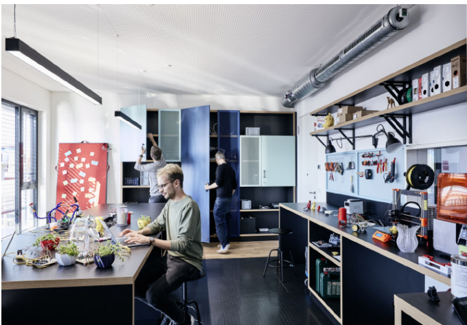
5 Prototyping Lab