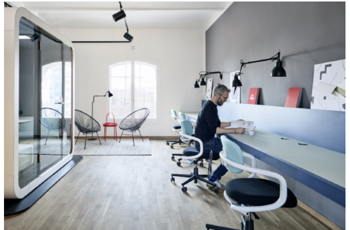
4 Wandresen für temporäres Arbeiten