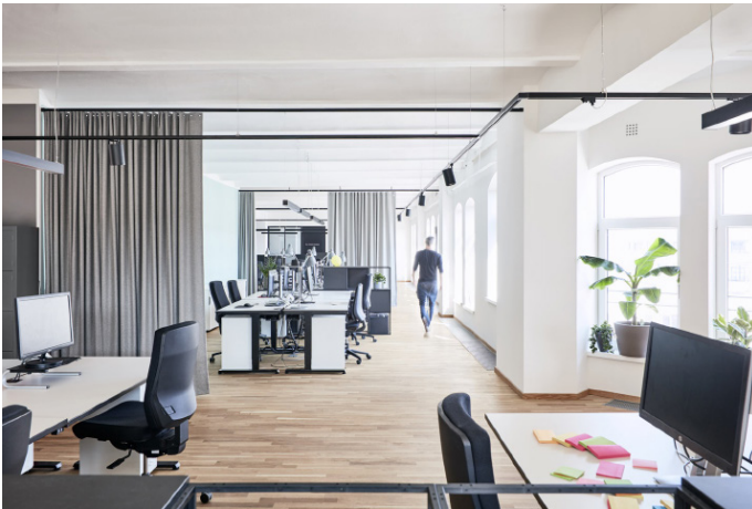
3 Open Space