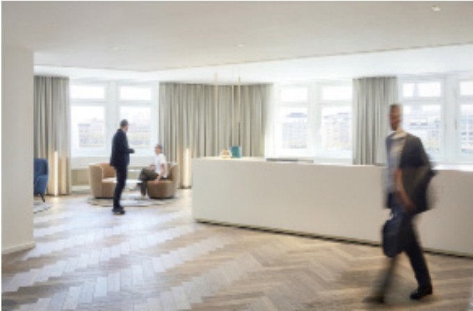
1 Empfang mit Wartelobby