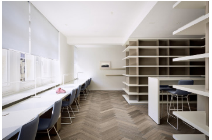
4 Temporäre Arbeitsplätze im Bibliotheksbereich