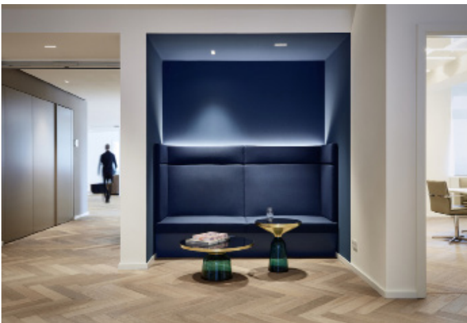
5 Rückzugsnische im Flurlauf