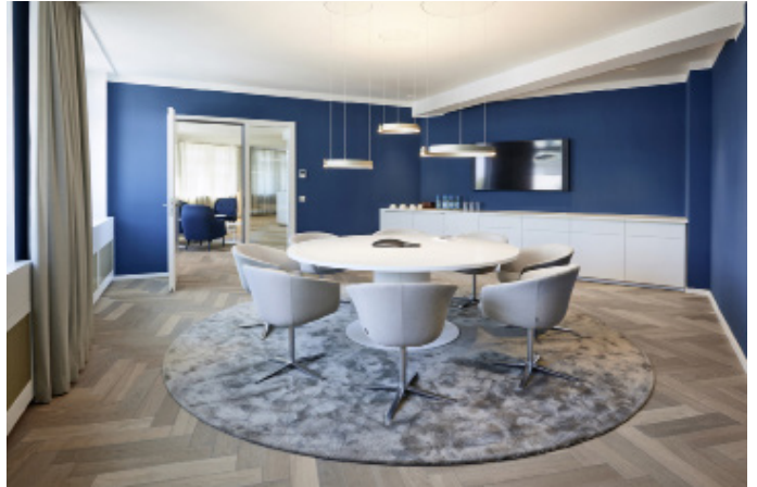
2 Konferenzraum 'Blauer Salon'